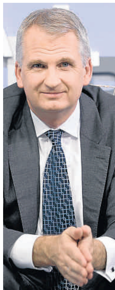
El escritor Timothy Snyder